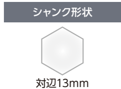
ハンマーシングルドリル〈六角軸〉(ロングタイプ) 全長 505mm