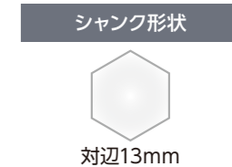
ハンマーシングルドリル〈六角軸〉(超ロングタイプ)