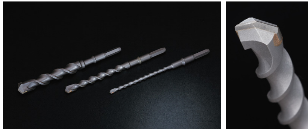
ハンマーシングルドリル〈六角軸〉(レギュラータイプ) 全長280mm