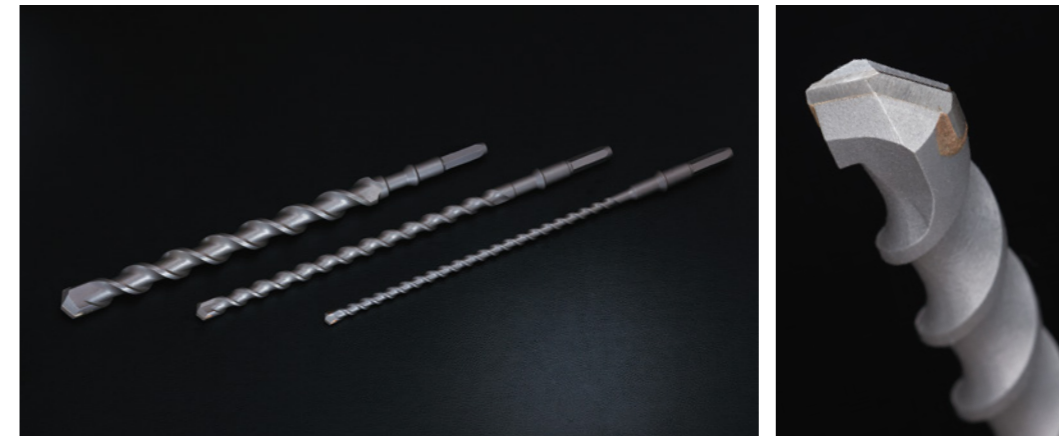
ハンマーシングルドリルロング〈六角軸〉(ロングタイプ) 全長420mm