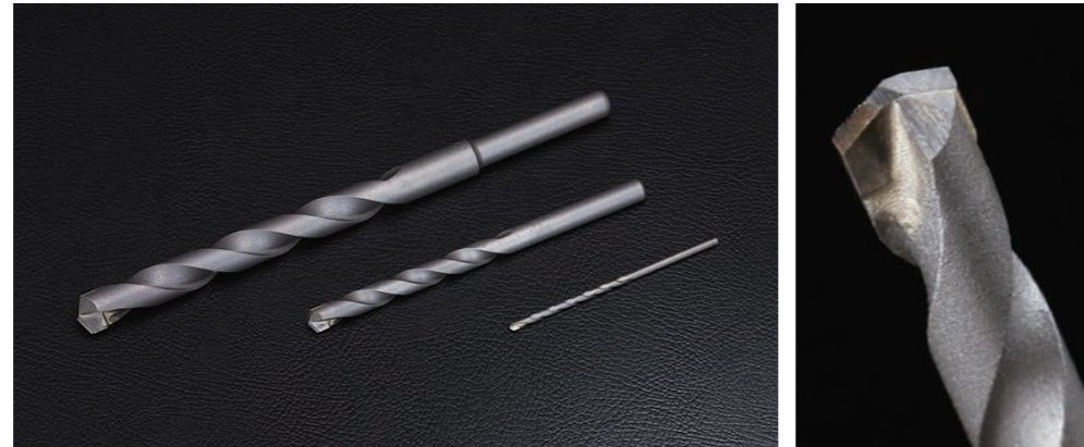
振動用Vシングルドリル(ストレート型)